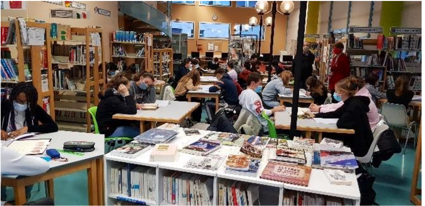
les élèves de 2G au CDI lors de la présentation des documents authentiques (16/10/2020)