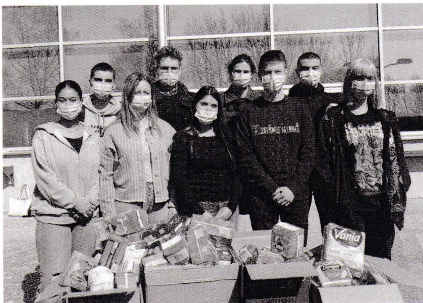
Des élèves se sont investis du 22 mars au 2 avril afin de recevoir les dons des autres lycéens et du personnel de l'établissement.

VILLERS-COTTERÊTS Pour lutter en faveur de l'égalité homme-femme, les élèves du lycée Européen se sont lancés dans une collecte de protections hygiéniques.