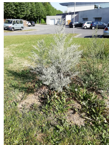
plantation au printemps 2021