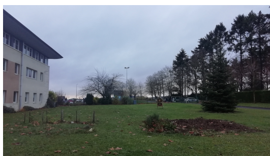
entretien à l'autonome 2020