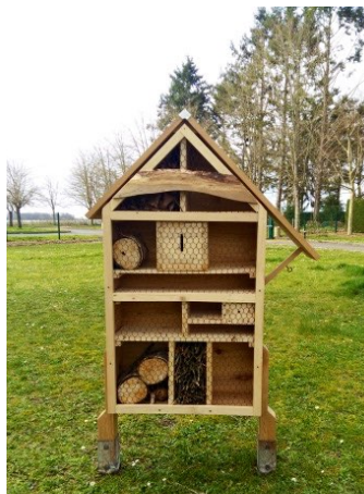
création et installation en 2019