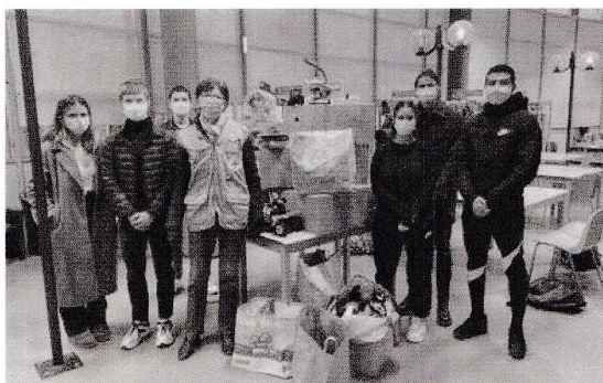
Lors de la remise des jouets à la Croix-Rouge avec les élèves du Lycée européen.