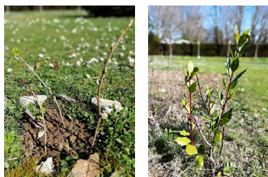
nouvelles pousses en mars 2022